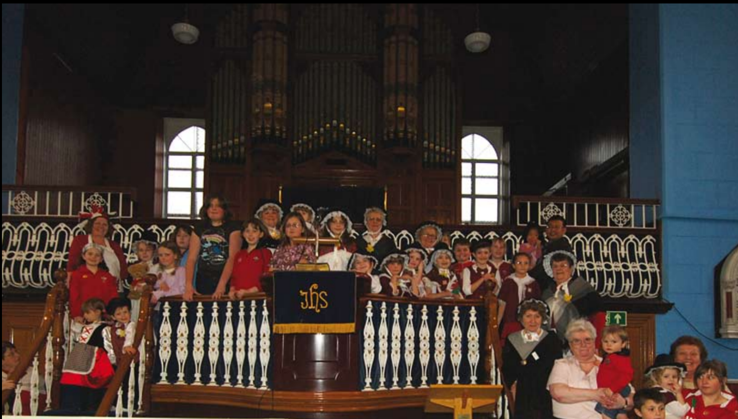
Cytgan olaf Eisteddfod Glyn Ebwy